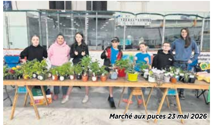
Marché aux puces 23 mai 2026