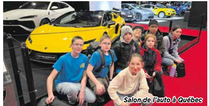
Salon de l'auto à Québec

C'est plus d'une trentaine jeunes du Kamouraska qui ont eu la chance de participer à notre programmation de la semaine relâche 2026. Voici un aperçu de nos activités. Lundi 2 mars, une sortie au musée de la Civilisation et à Exode Québec où nous avons essayé d'élucider 2 défis. Malheureusement, nous n'avons pas eu assez de temps, mais beaucoup de plaisir. Mardi 3 mars, un souper à la MDJ suivi de l'écoute de plusieurs films bien installés sur nos divans. Mercredi 4 mars, nous avons fait un immense fort de neige et mangé de la tire. Les amateurs de sucré se sont régalés. Jeudi 5 mars, avec la Ville de La Pocatière, nous sommes allés à la maison de la BD et à Obstak Québec style ninja warrior. Vendredi 6 mars, une visite au salon de l'automobile à Québec. Pour conclure cette belle semaine, samedi 7 mars, nous avons fait une